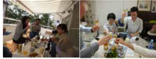
シューズボックスの開放的なバルコニー 広いリビングにはピアノも！

居住者ブログ http://town-collective-shin-egota.blogspot.jp/