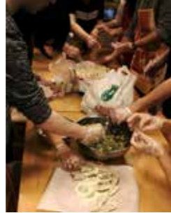
餃子を作る手・手・手