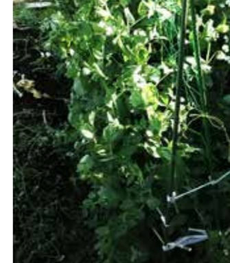
収穫と一緒に花の持ち帰り