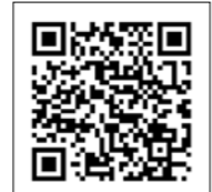
その他の空室情報はこちら

閑静な住宅街にある一軒家。都心へのアクセスも良く、西武池袋線・江古田駅の周辺には日大芸術学部や武蔵野音楽大、武蔵大の学生さんの姿も。近くには散歩や運動にピッタリな江古田の森公園があります。