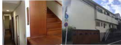
外装・内装とも自らが監修です 地下には駐輪場もあります