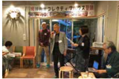
居住者の皆さんの開催して下さったパーティ。大家さんとも大盛り上がり